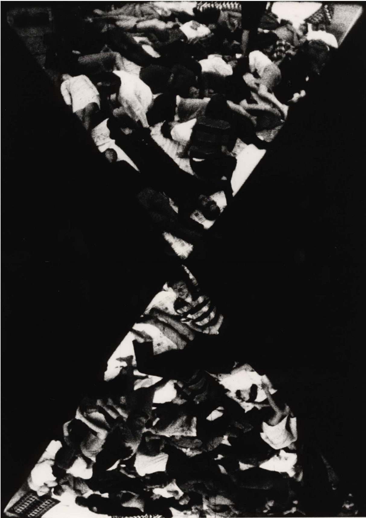
Gurtrug Nr 2 (1967)